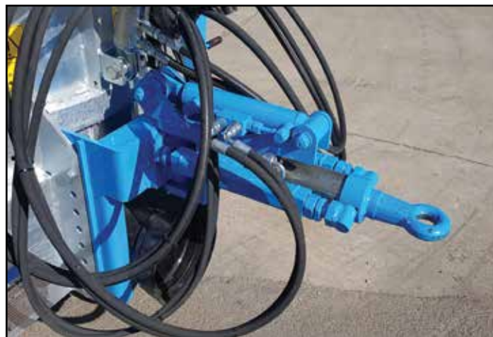
Timone sterzante idraulico