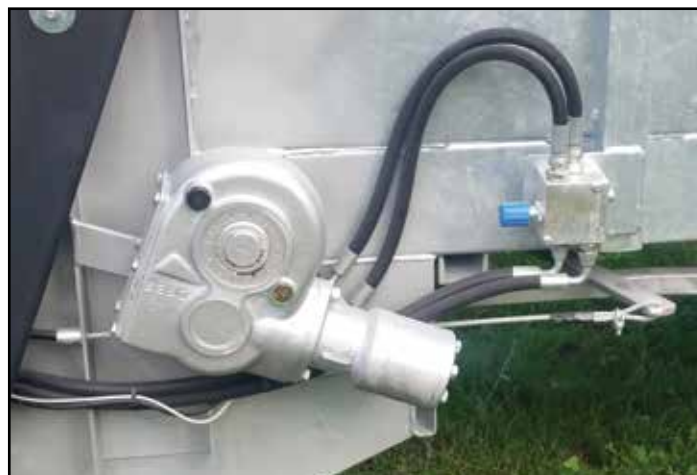
Traino idraulico con valvola di regolazione della velocità